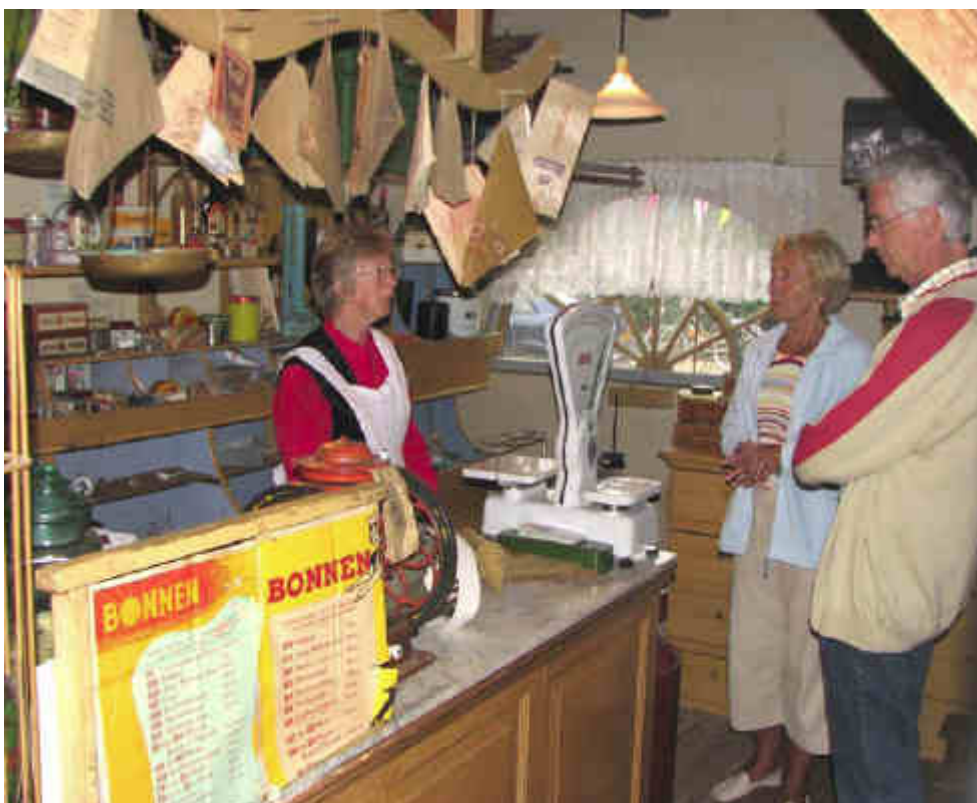
Mag het misschien een ietsje meer zijn...?"

Middels deze Nieuwsbrief worden leden verzocht om hun contributie voor het jaar 2008 over te maken. De minimum-contributie voor leden is door de ALV van 2006 vastgesteld op €15, terwijl de minimum- donatie voor bedrijven €50 is. Het bestuur verzoekt u om deze bijdrage over te maken op een van deze rekeningnummers: Rabobank - 34.52.94.203, of Postbank -27.22.63, onder vermelding van 'contributie 2008' Bij voorbaat dank! "